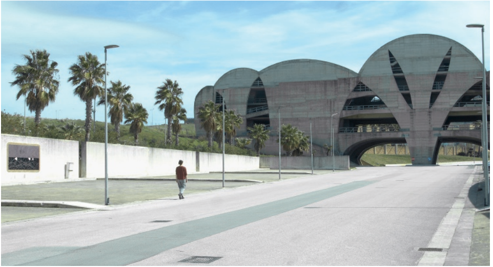
Sebastian Utzni · Filmstill aus «αφασία (Aphasia)», 2023, Still aus Video, 22'