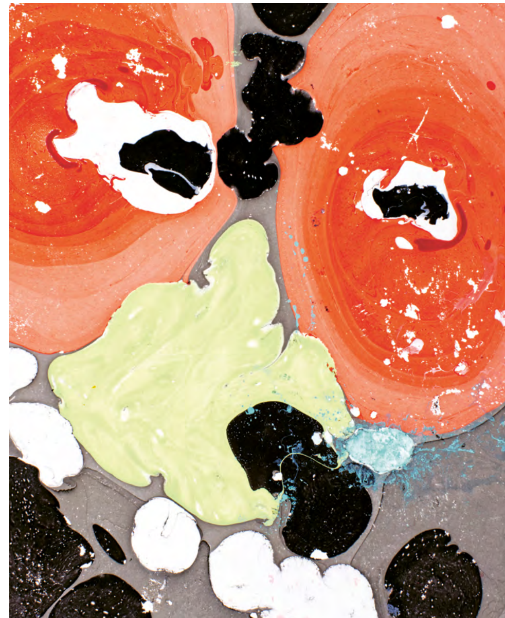
Was oder wer starrt uns hier an? Für die fotografische Serie «Nachtmahre» liess Nathalie Bissig Farben auf die Wasseroberfläche tropfen. Die eigenwilligen Formen entziehen sich einer einfachen Zuordnung.

Solche Grenzen überwindet die vielseitige Urner Künstlerin in der Ausstellung im